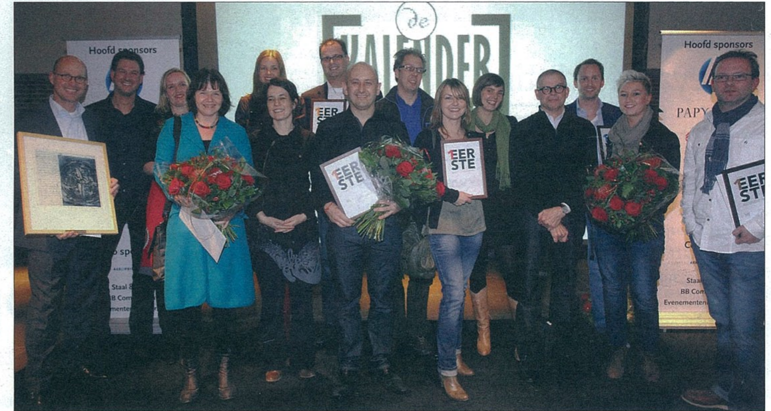
Veel blije gezichten bij de winnaars van de Kalenderwedstrijd